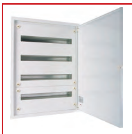
MODUL 160 COMPACT szekrények