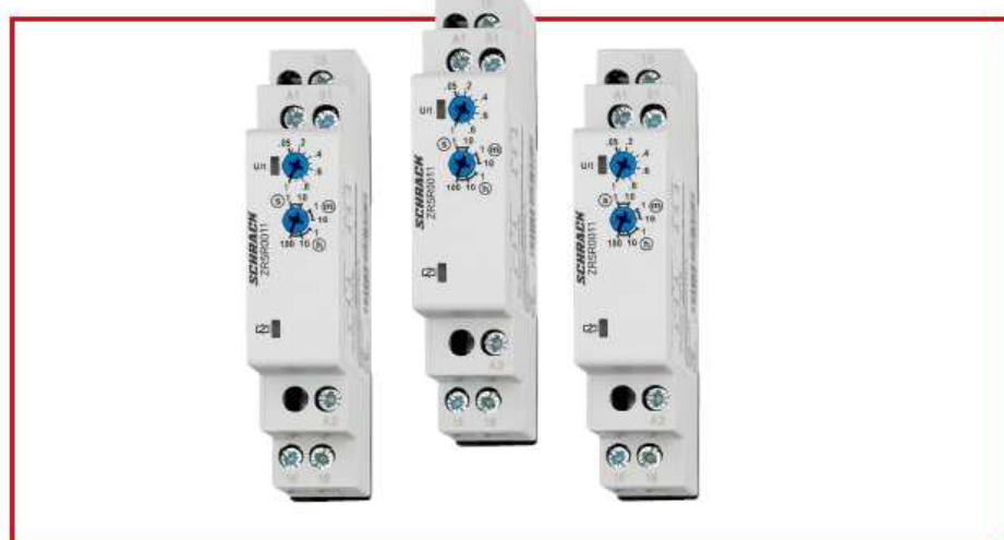
ZR 5R0 011

7 időzítés beállítási tartomány Széles tápfeszültség tartomány 1 váltó érintkező 17,5 mm széles